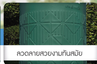
ลดทลายสวญงามกันสนับ