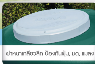
ฝาหนาเกลียวลึก ป้องกันฝุ่น, เมด, แอมส