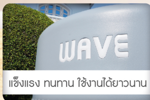
แข็งแรง ทนทาน ใช้งานได้ยาวนาน