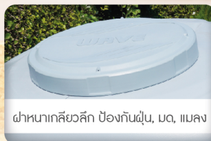
ฝาหนาเคลือบสี ป้องกันฝุ่น, เมด, แบคทีเรีย