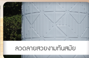
ลดทลายสลายงามทันสมัย