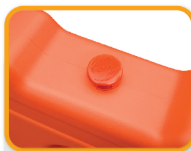
วัสดุคุณภาพ