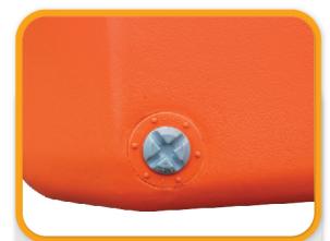
จุดอุดรูน้ำทิ้ง

Facebook: WAVE WATER INNOVATION | YouTube: WAVE WATER INNOVATION