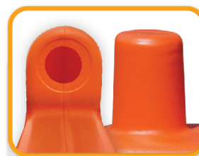
ตัวยึดล็อกใหญ่และลึก