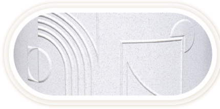
ลวดลายทันสมัย