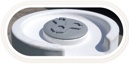
ดีไซน์หัวถังแบบใหม่

หัวถังแบบสโลปด้านใน ไม่ทำให้น้ำขัง และสามารถตกแต่งหัวถังด้วยต้นไม้ต่าง ๆ ให้เข้ากับสวนในบ้านคุณ