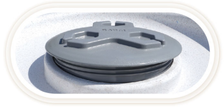
ฝาหนา เกลียวลึก