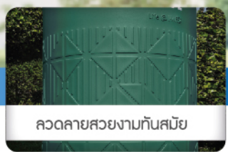
ลดรอยสอยงามทันสมัย