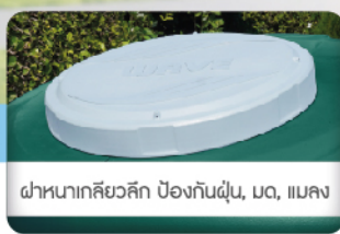
ฝาหนาเกลียวลึก ป้องกันฝุ่น, เมด, แบค