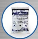
หัวเชื้อจุลินทรีย์ ชนิดพิเศษแบบแห้งที่มีประสิทธิภาพสูง ใช้สำหรับเติมในถังบำบัดน้ำเสีย