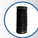
ข้อต่ออ่อนยางธรรมชาติ 4x12 นิ้ว ทำจากยางธรรมชาติมีความยืดหยุ่นสูงพร้อม สายรัดคาดแน่นเคลือบด้วยยาฆ่าเชื้อเพื่อยืดอายุการใช้งาน