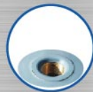
ท่ออากาศ เทคยวโนทองเหลือง