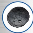
ฝากลม สำหรับติดตั้งในสวน